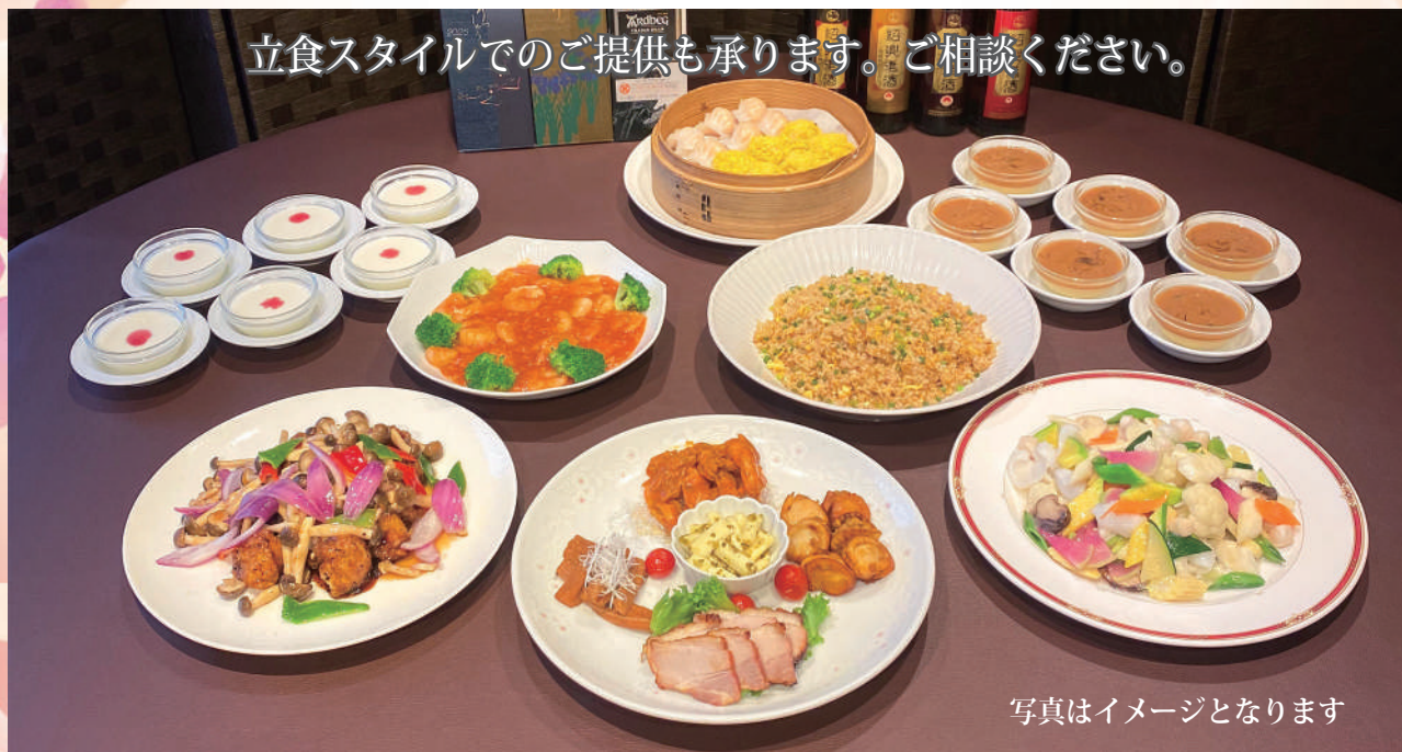
写真はイメージとなります

各種個室からホール貸切120名様ご立食迄、ご要望に合わせてお部屋をご用意いたします。