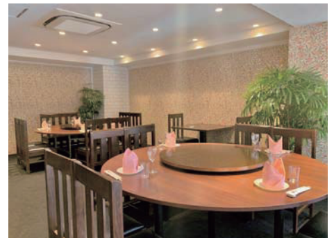
24名用のお部屋に8席レイアウト