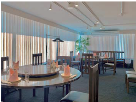
20名用のお部屋に8席レイアウト