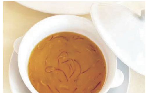
花壇名物の「フカヒレスープ」