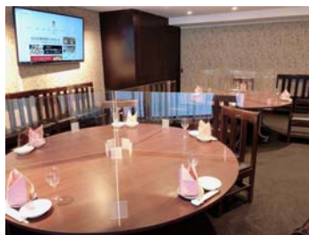
アクリル板のご用意も承ります